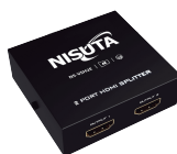
NS-VSH2E » 2 PUERTOS