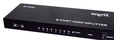
NS-VSH8E » 8 PUERTOS