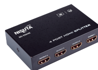
NS-VSH4E » 4 PUERTOS